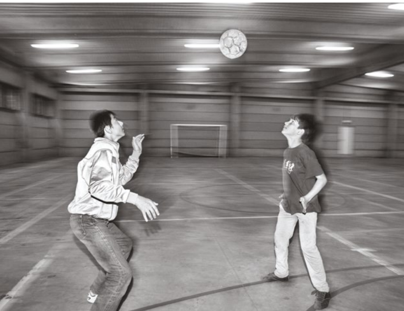
Jonge vluchtelingen verdrijven even hun verveling in het asielcentrum van Bovigny, 25/08/2011