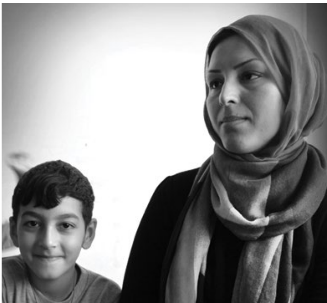
Afghaanse asielzoekers in Brussel