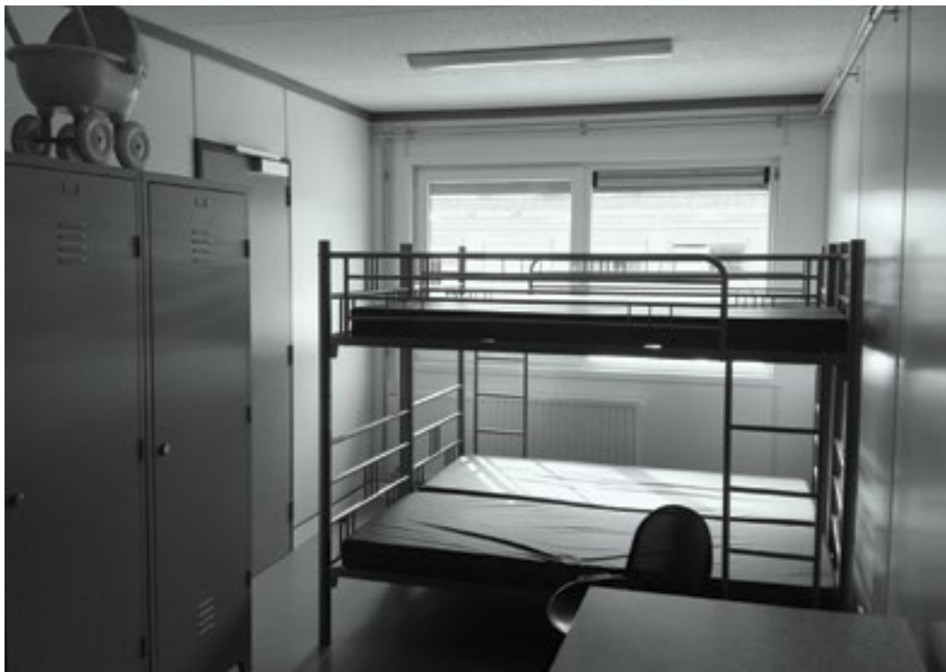
Slaapkamer in de terugkeerplaatsen van Jodoigne