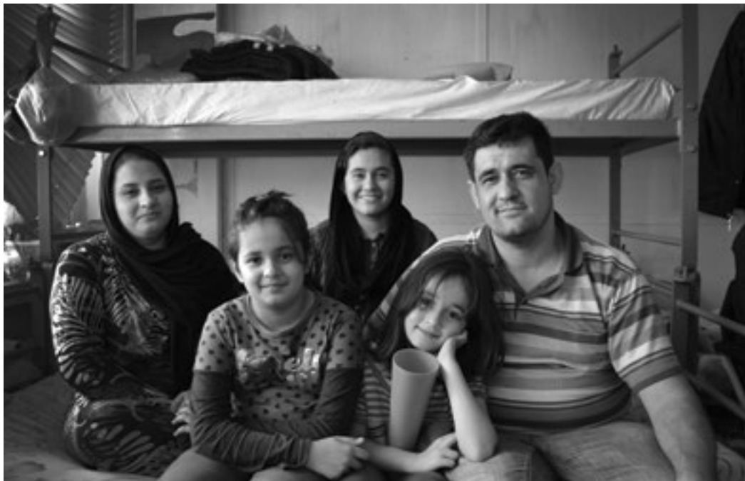
Afghaanse asielzoekers in Brussel

We laten de stem van beleidsuitvoerders horen aan de beleidsmakers. In de hoop dat zij zich bewust worden van de hoge menselijke kost van het systeem. En hopelijk houden ze er rekening mee.