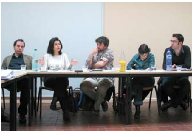
Politic debatteren over de belangrijkste punten uit het Memorandum

Deze aanbevelingen werden besproken op het kabinet van de minister van Maatschappelijke Integratie en zijn voorgesteld op een afsluitende studiedag op 23 oktober 2007 aan een ruimer publiek. De beleidsaanbevelingen werden afgetoetst bij de beleidsmakers zowel op het Vlaamse als het federale niveau.