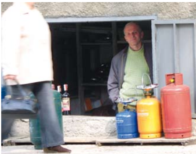
Geïndividualiseerde Hulp bij Reïntegratie - Albanië

In 2007 begeleidde Vluchtelingenwerk 25 asielzoekers en afgewezen asielzoekers bij hun reïntegratie in Rusland. Achttien van hen keerden effectief terug. Vijf anderen vertrokken in januari 2008. Terugkeren naar het herkomstland blijft voor velen een taboe. In 2007 verlieten bijna 2.600 vreemdelingen ons land met ondersteuning van het terugkeerprogramma van de Internationale Organisatie voor Migratie (IOM). Dat zijn er zo'n 200 minder dan in 2006. In meer dan de helft van de gevallen ging het om mensen zonder papieren. De anderen waren asielzoekers die hun asielaanvraag hadden ingetrokken of van wie de aanvraag geweigerd was. De belangrijkste landen van ondersteunde terugkeer zijn Brazilië (805), Oekraïne (244), Armenië (184), de Russische Federatie (158) en Mongolië (142). IOM gaf aan deze mensen een basisondersteuning zoals het regelen van de reisdocumenten en van de reis.