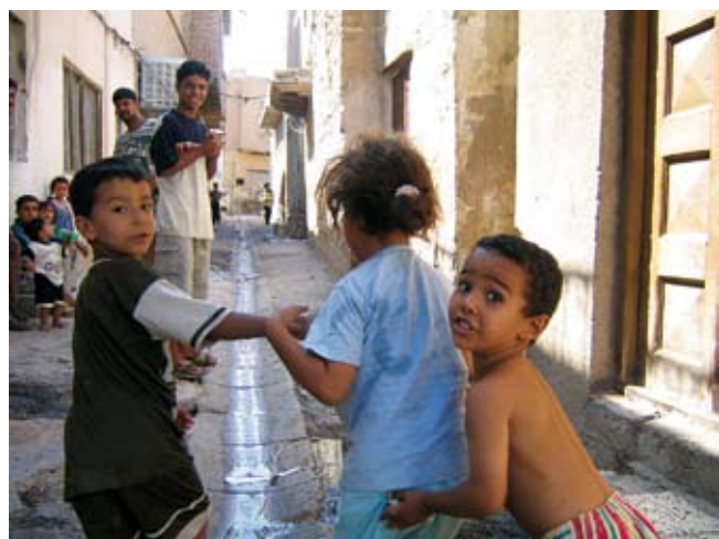
kinderen in Irak

Het is maar een greep uit de vele vragen van de dienst ‘PlanetSearch’ van Vluchtelingenwerk. Via PlanetSearch kunnen hulpverleners, vrijwilligers en advocaten relevante landeninformatie opvragen. Correcte landeninformatie kan het asielrelaas onderbouwen of de ernst van een (vervolgings-) situatie in het land van herkomst aantonen. De medewerker van PlanetSearch gebruikt verschillende methoden en technieken. Relevante bronnen zijn vaak rapporten van mensenrechtenorganisaties en NGO’s. PlanetSearch is abonnee bij een aantal grote persdatabanken. De vragensteller krijgt de gevraagde landeninformatie per brief of per mail toegestuurd.